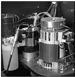
Potente motor de CA