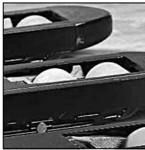
Horquillas con puntas redondas