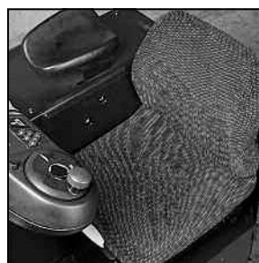
Asiento totalmente ajustable

Estas especificaciones pueden cambiar debido a las continuas mejoras.