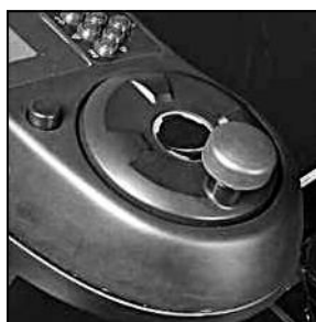
Dirección eléctrica asistida