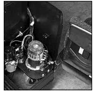
Acceso de servicio de apertura oscilante