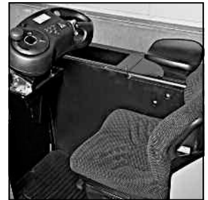
Compartimiento ergonómico del operador