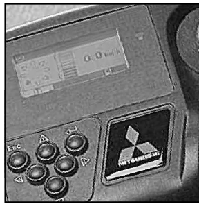
Completa pantalla LCD