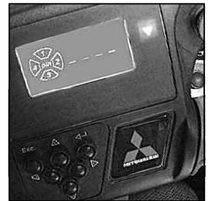
Arranque con código PIN

Ast = Ancho del pasillo Ast3 = Ancho del pasillo ( b_{12} \leq 1000 \text{ mm} ) Ast = Wa + \sqrt{(l_6 - x)^2 + (b_{12} / 2)^2} + a Ast3 = Wa + l_6 + a Wa = Radio de giro l6 = Largo del palet x = Distancia de carga b12 = Ancho del palet a = Margen de seguridad = 2 \times 100 \text{ mm}